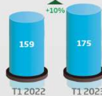
Chiffre d'affaires (consolidé, en MDh)