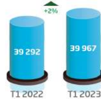
Activité en volume (consolidé, en nbre de dossiers)