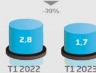
Investissements (consolidé, en MDh)